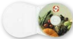
Art. 30206 Shell-PP-Hülle