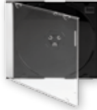
Art. 20529 CD SlimCase

Patienten Name: Geburtsdatum: Behandlungsdatum: Behandlungsbeschreibung: Behandlungs ID: Disk: