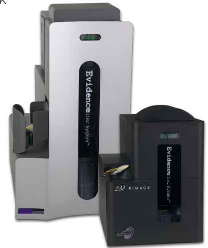
EDS Enterprise Producer 8100N